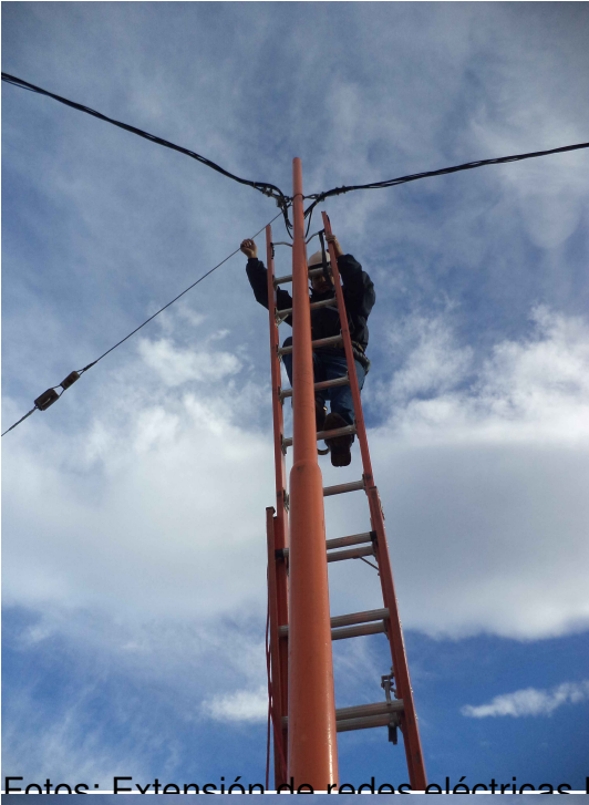
Fotos: Extensión de redes eléctricas Barrio Federal - El Maitén.