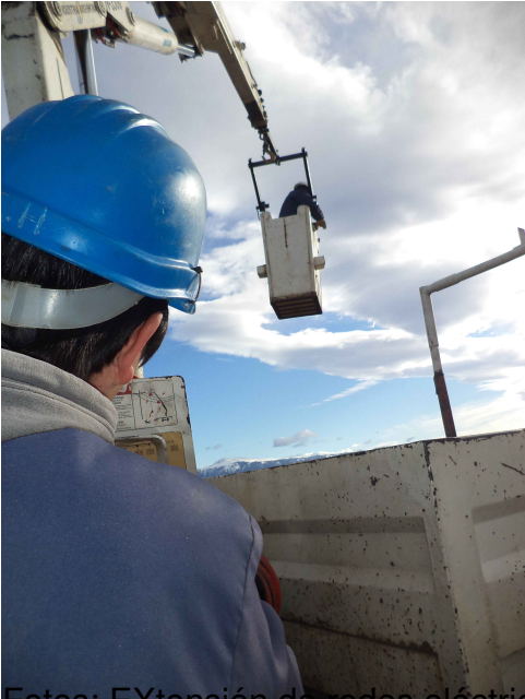
Fotos - Extensión de redes eléctrica Barrio Costanera - El Maitén